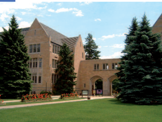
St. Thomas Campus - Minnesota

Nei limiti dei posti disponibili, la partecipazione al US Corporate Visit Program è aperta anche a coloro che non sono iscritti al Master. In tal caso è prevista una fee di iscrizione al programma a carico del partecipante.