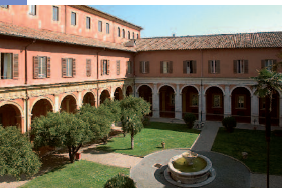
Cortile Angelicum - Roma